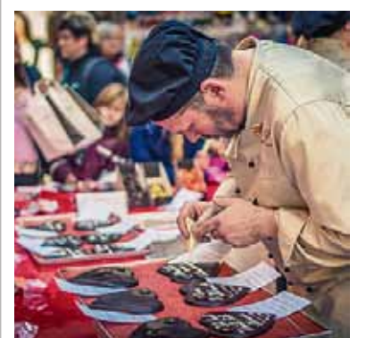
Ein Chocolatier verzierte zum Valentinstag Schokoladenherzen.

Süße Liebe Weil der Valentinstag in diesem Jahr auf einen Sonntag fiel, war in der SACHSEN-ALLEE bereits der 13. Februar der Tag für alle Verliebten. Zuckersüße Liebesbekundungen gab es dabei von einem Chocolatier, der im Center für insgesamt 200 Paare Schokoherzen individuell veredelte. Ein Erinnerungsfoto gab es obendrauf.